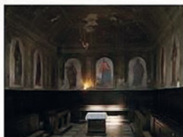
ORATORIO DELLO SPIRITO SANTO