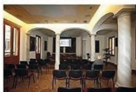
PARTECIPANZA AGRARIA Sala delle Colonne