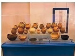
MOSTRA ESPOSITIVA "La Villa nel Pozzo" Museo Archeologico Ambientale