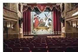
TEATRO COMUNALE "Ferdinando Bibiena"