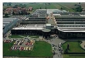
AUTOMOBILI LAMBORGHINI Museo Automobili Lamborghini